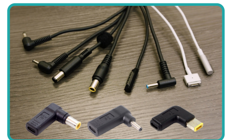
Cables adaptadores emuladores

El carro de carga Elevate Max USB-C cuenta con puertas dobles, lo cual le permite ocupar menos espacio, y ruedas giratorias que lo hacen más fácil de maniobrar en el aula. El carro de carga Elevate Max USB-C de alta capacidad carga y protege una gran cantidad de dispositivos y al mismo tiempo mejora el proceso de carga en el aula. Lo mejor de todo es que, gracias a la tecnología de carga por USB-C Quick-Sense, elimina la necesidad de usar cables de carga adaptadores de CA.